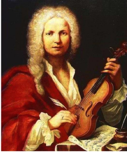
Antonio Vivaldi 1678-1741)

4 Mart 1678; Venedik - 28 Temmuz 1741, Viyana.