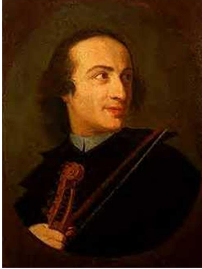
Giuseppe TARTINI (1692-1770)