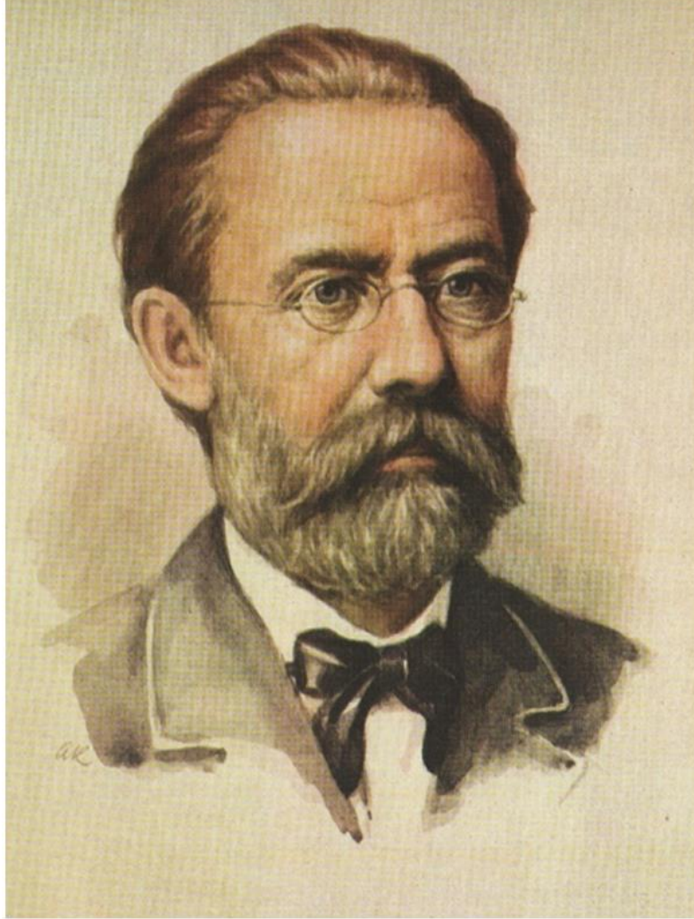
Bedřich SMETANA (1824-1884)

2 Mart 1824, Litomyšl, Bohemya – 12 Mayıs 1884, Prag