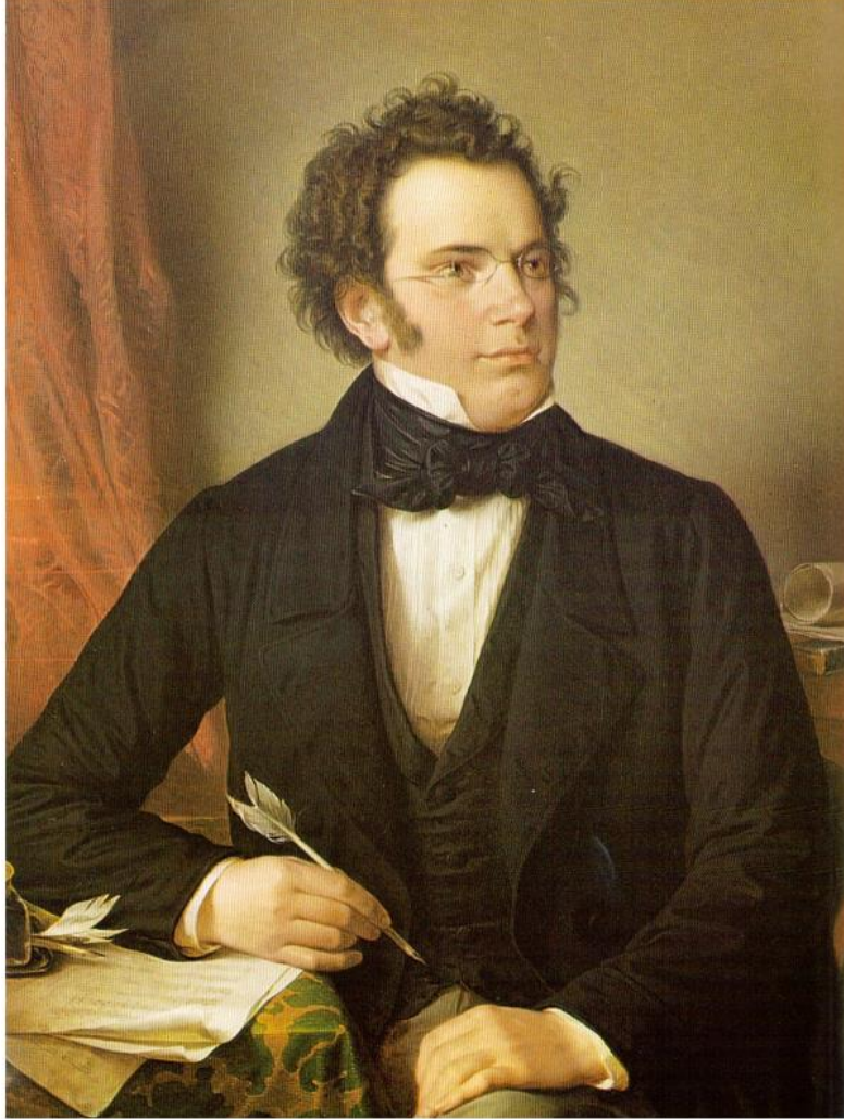
Franz SCHUBERT (1797-1828)

31 Ocak 1797, Viyana – 19 Kasım 1828, Viyana.