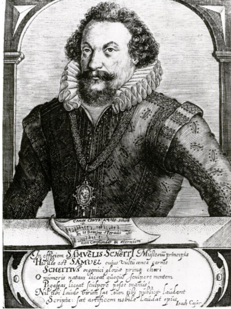
Samuel SCHEIDT (1587-1654)

24 Mart 1587, Halle – 4 Kasım 1654, Halle.