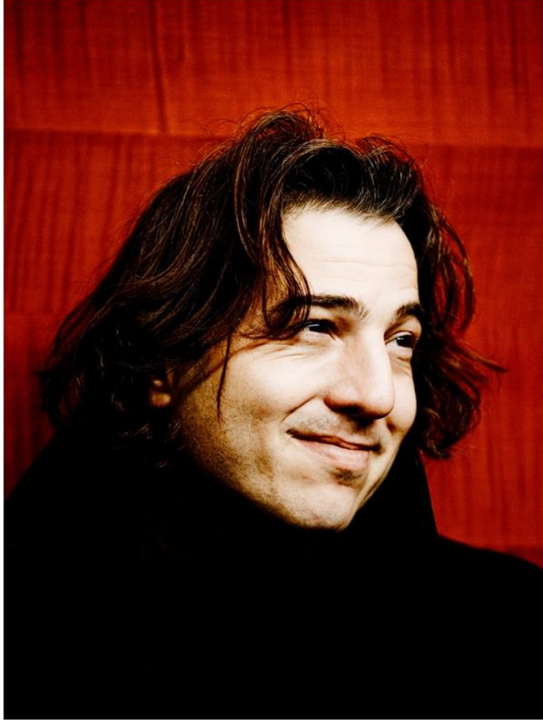
Fazıl SAY (1970- )

*Harem kadınları portreleri *Âlem gecesı *Kâtibim teması üzerine romantik rapsodi *Final