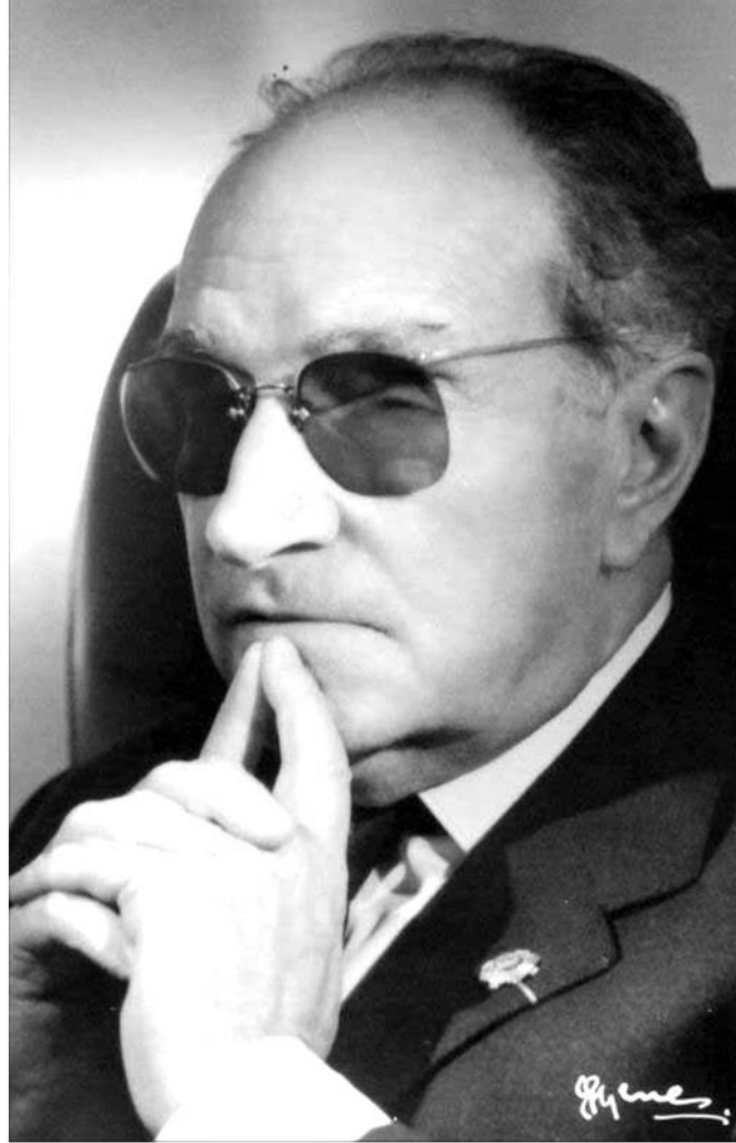
Joaquin RODRİGO (1901-1999)

22 Kasım 1901, Sagunto, İspanya – 6 Temmuz 1999, Madrid, İspanya.