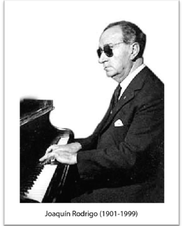
Joaquín Rodrigo (1901-1999)

Sekiz yaşında solfej, piyano ve keman eğitimine başladı. On altı yaşında armoni ve kompozisyon dersleri aldı. Beklenenin aksine, gitar repertuarı için evrensel bir müzik aleti olarak saygınlık kazanmış İspanyol gitarlarını hiçbir zaman çok iyi çalamadı.