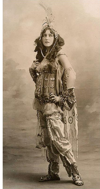
Ida Rubinstein (1883-1960)

Günümüzde, müzikle ilgisi olmayanların bile tanıdığı Bolero, ilk kez 22 Kasım 1928'de Paris Operası sahnesinde yorumlandı. Bronizlava Nijinska'nın koreografisini yaptığı, Ida Rubinstein'in canlandığı eserin herhangi bir konusu yoktur.