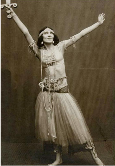
Ida Rubinstein (1883-1960)

Ravel, dansçı Ida Rubinstein'a bir bale müziği yazmak için söz vermişti. Bunun için de Albeniz'in İberia'sının orkestrasyonunu düşünüyordu. Ancak telif hakkı bir başkasına ait olan eserden vazgeçerek, sabit bir fikir gibi kafasında sürekli duyduğu 16 ölçülük ezgiyi ele aldı. Arkadaşına yazdığı bir mektupta eserinin ileride göreceği büyük ilgiyi bilmeden, alçakgönüllülikle şöyle diyordu: "Alışlagelmiş şekilde bir formu, bir geliştirimi (developpement) yok; ton değişimi (modulasyon) bile yok sayılabilir. Padilla tarzında bir tema, saf bir ritim ve orkestra için yazıldı."