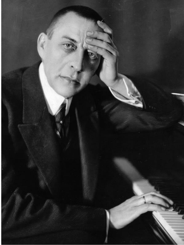
Sergei RACHMANINOFF (1873-1943)

1 Nisan 1873, Semionova, Rusya – 28 Mart 1943 Beverley Hills, California, ABD.