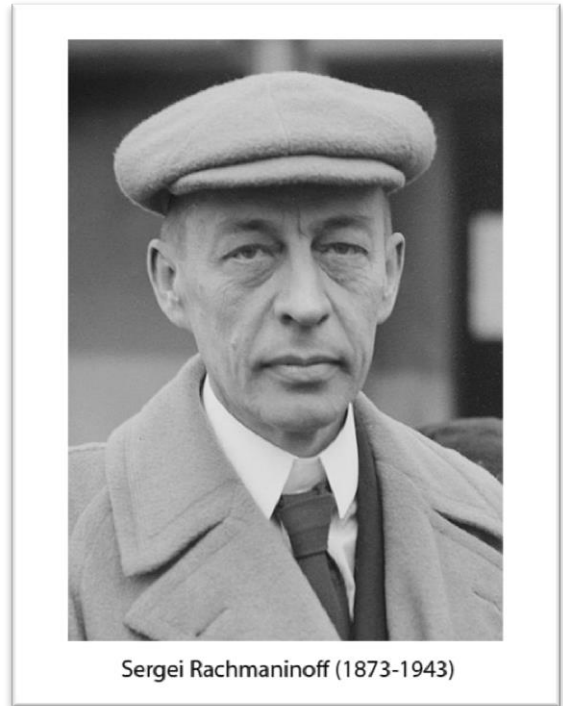
Sergei Rachmaninoff (1873-1943)