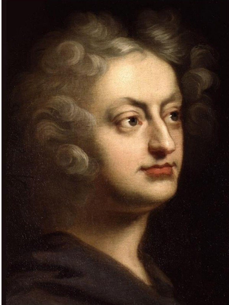
Henry PURCELL (1659-1695)