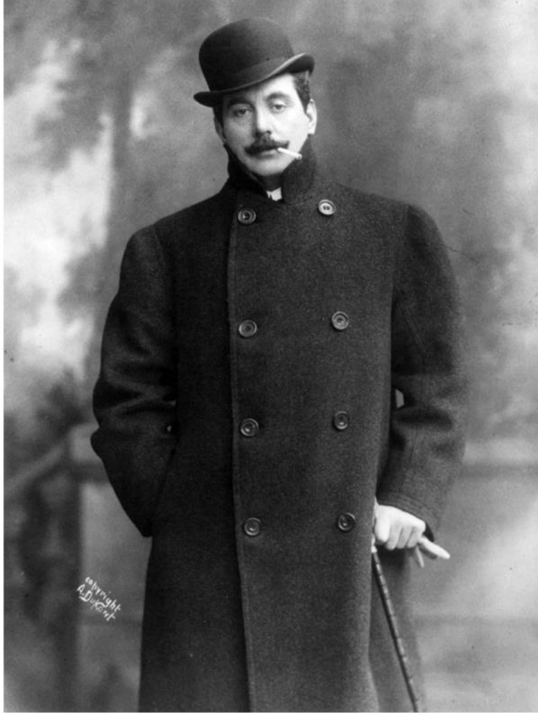
Giacomo PUCCINI (1858-1924)

Giacomo Antonio Domenico Michele Secondo Maria Puccini ya da kısaca Giacomo Puccini