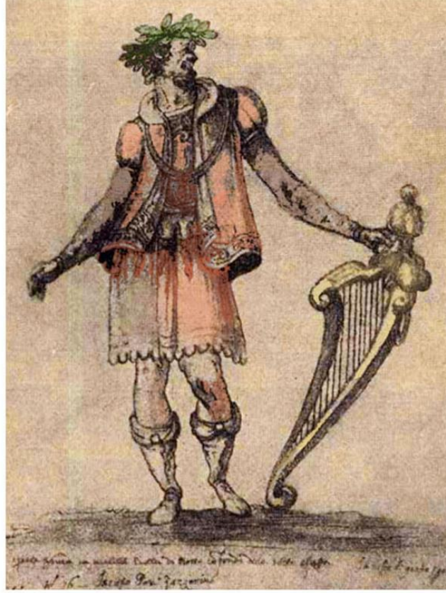
Jacopo Peri (1561-1633)

20 Ağustos 1561, Roma – 12 Ağustos 1633, Floransa.