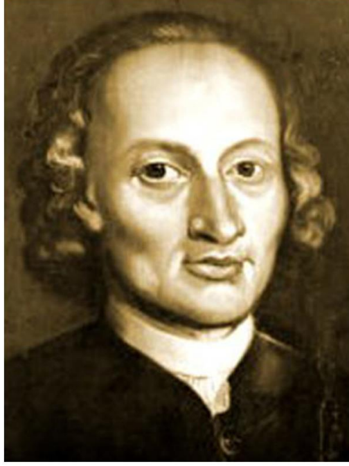
Johann PACHELBEL (1653-1706)