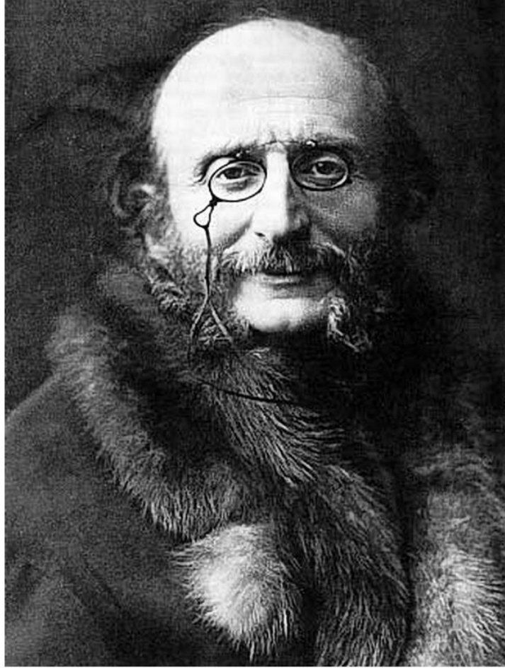
Jacques OFFENBACH (1819-1880)

20 Haziran 1819 Kln, Almanya - 5 Ekim 1880 Paris