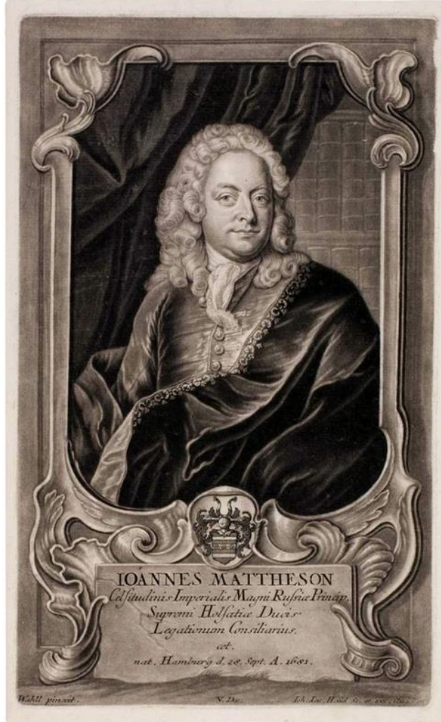
Johann MATTHESON (1681-1764)