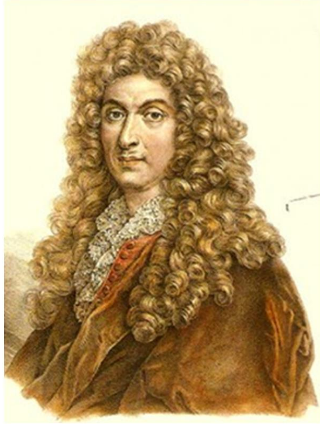
Jean-Baptiste LULLY (1632-1687)

28 Kasım 1632, Floransa, İtalya – 22 Mart 1687 İtalyan asıllı besteci, kemancı, balet.