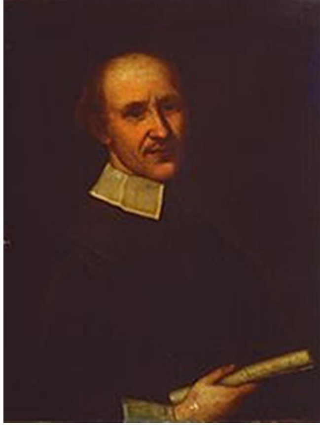
Giovanni LEGRENZI (1626-1690)