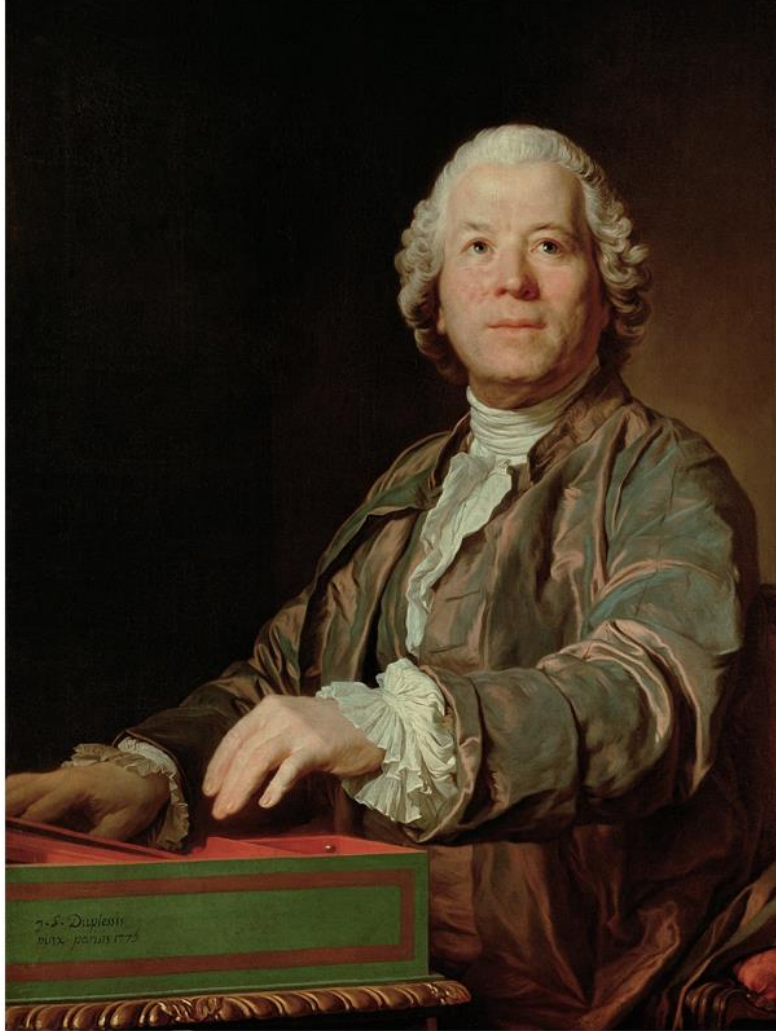
Christoph Willibald GLUCK (1714-1787)

2 Temmuz 1714, Erasbach – 15 Kasım 1787, Viyana. Alman besteci.