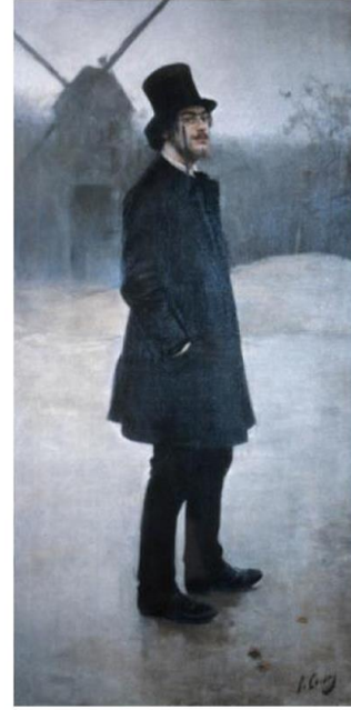
Erik SATIE (1866-1925)

Satie, fakir ve sefil odasında 1 Temmuz 1925'te, aşırı alkol yüzünden yakalandığı sirozdan öldüğünde geriye sayısız takma yaka, eski gazete yığınları, birkaç partiyon ve pedalı ipte tutturulmuş bir piyano bırakmıştı.