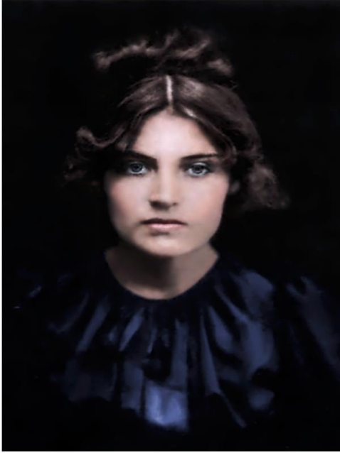
Suzanna VALADON (1865-1938)

1886'da sivri gotik kemer anlamına gelen Ogive adını taşıyan (4 Ogives) parçalarda da gösterdi. Bu piyano parçaları daha önceki bir iki valsten sonraki ilk önemli eseri idi. Paris'te nota yayıncılığına başlayan babası, 1887'de onun şarkılarını yayımladı. Satie aynı yıl Debussy'yi de etkileyecek olan üç Sarabande'sini yazdı. Ertesi yıl 3 Gymnopedie yayımlandı. 1890'da yine piyano için, adını Girit'teki Knossos sarayının dini olayları yorumlamanın felsefi yöntemi olan Gnosis'ten alan, ölçüsü ve mezür çizgileri olmayan, hagig doğu havasındaki 3 Gnossiennes'i besteledi.