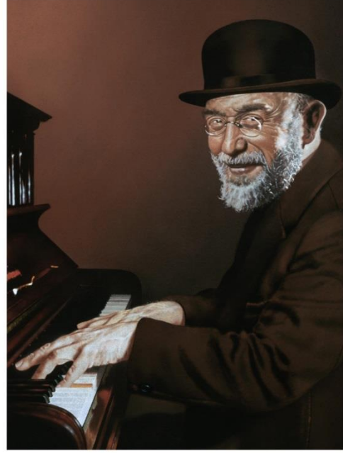
Erik SATIE (1866-1925)

Suzanne Valadon ile fırtınalı bir aşktan sonra yeniden müzik öğrenimine başladı. Bu çılgın 15 yılın en önemli ürünü de çoğu kabare melodilerinin düzenlenmesini içeren dört el piyano için (3 Morceaux en Forme de Poire" (Armut Biçiminde 3 Parça, 1890-1903) ve piyano için "Pièces Froides" (Soğuk Parçalar, 1897) oldu.