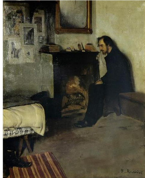
Erik SATIE (1866-1925)