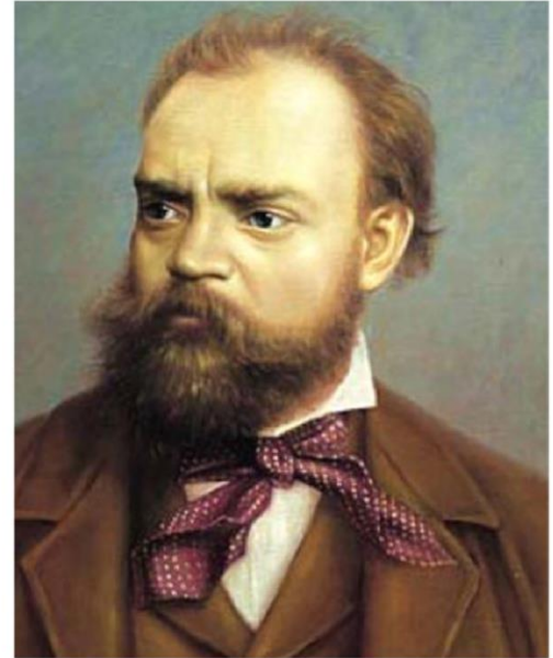
Antonín Dvořák (1841-1904)

Bununla beraber, senfonik şiirleri (Vodnik, Polednice) orkestral müzik açısından önemli eserleridir.