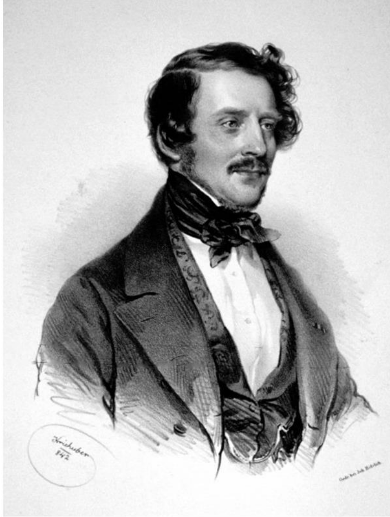
Gaetano DONIZETTI (1797-1848)