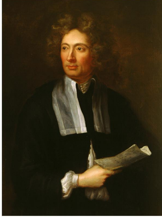
Arcangelo CORELLI (1653-1713)

17 Şubat 1653, Fusignano, İtalya – 8 Ocak 1713, Roma.