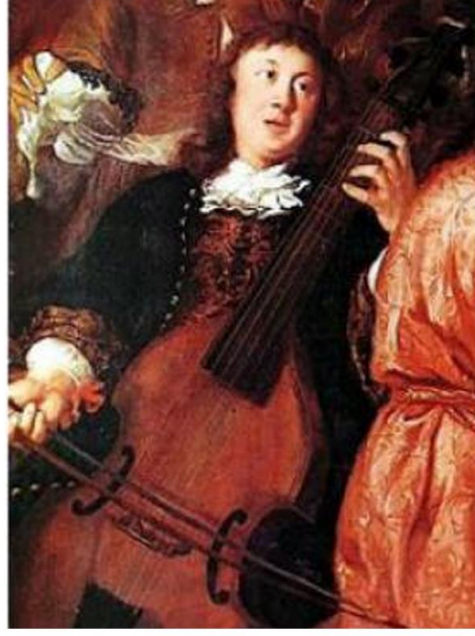
Dietrich BUXTEHUDE (1637-1707)

1637, Helsingborg (Oldesloe'da doğduđu da iddia edilir) – 1707, Lübeck.