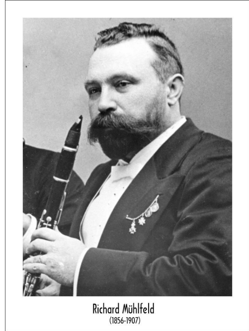
Richard Mühlfeld (1856-1907)

eserler, özel bir yalnızlığı, aynı düşüncedeki dostlar arasında içe dönük müzik yapma, düşünceye dalış ve doğaçlamayı yansıtır.