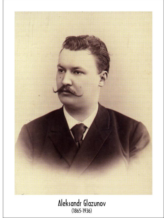
Aleksandr Glazunov (1865-1936)