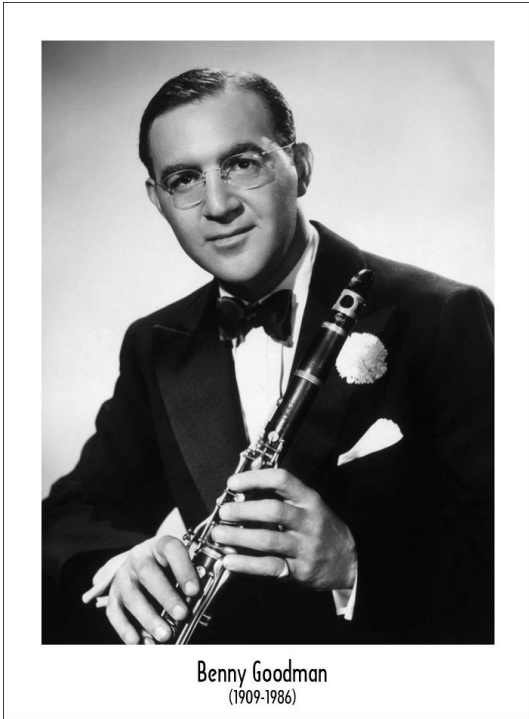
Benny Goodman (1909-1986)

Béla Bartók "Kontrastlar" adlı eserini, aslında bir Amerika turnesi için, ünlü caz klarinetçisi Benny Goodman (1909-1986)'ın siparişi üzerine 1938'de yazmıştır. Bu konserlere Goodman'dan başka kemancı Joseph Szigeti ile besteci de piyanist olarak katılacaktı. Goodman, eserin 25 cm'lik (eski 78 turlu) plağın her iki yüzünü de dolduracak uzunlukta olmasını istemişti.