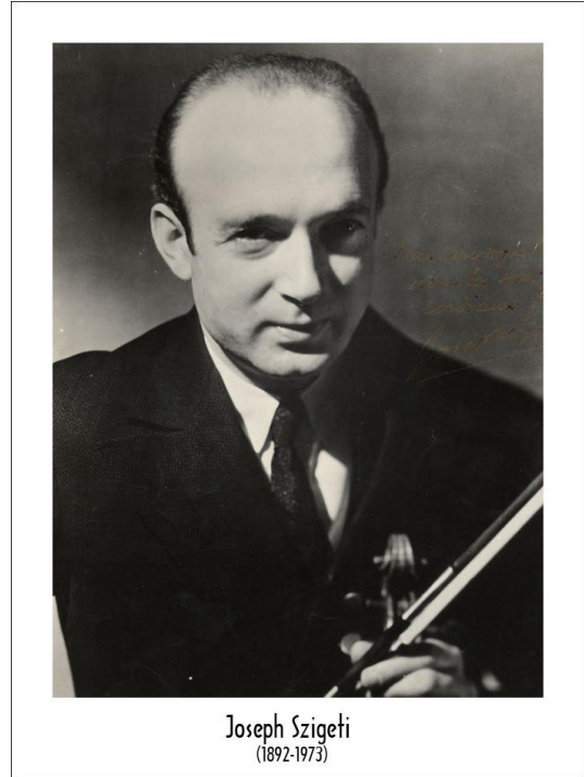
Joseph Szigeti (1892-1973)

uyum sağlayacağını düşünüyor, çalgıyı bu kadroda karşıtlık oluşturacak şekilde ele alıyordu.