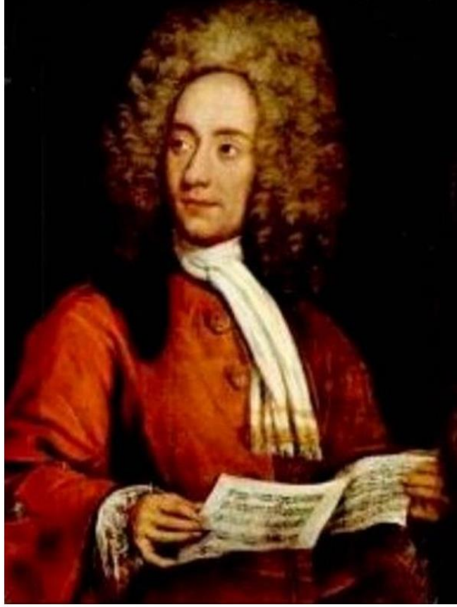
Tomaso ALBINONI (1671-1751)

8 Haziran 1671, Venedik,-İtalya - 17 Ocak 1751 Venedik