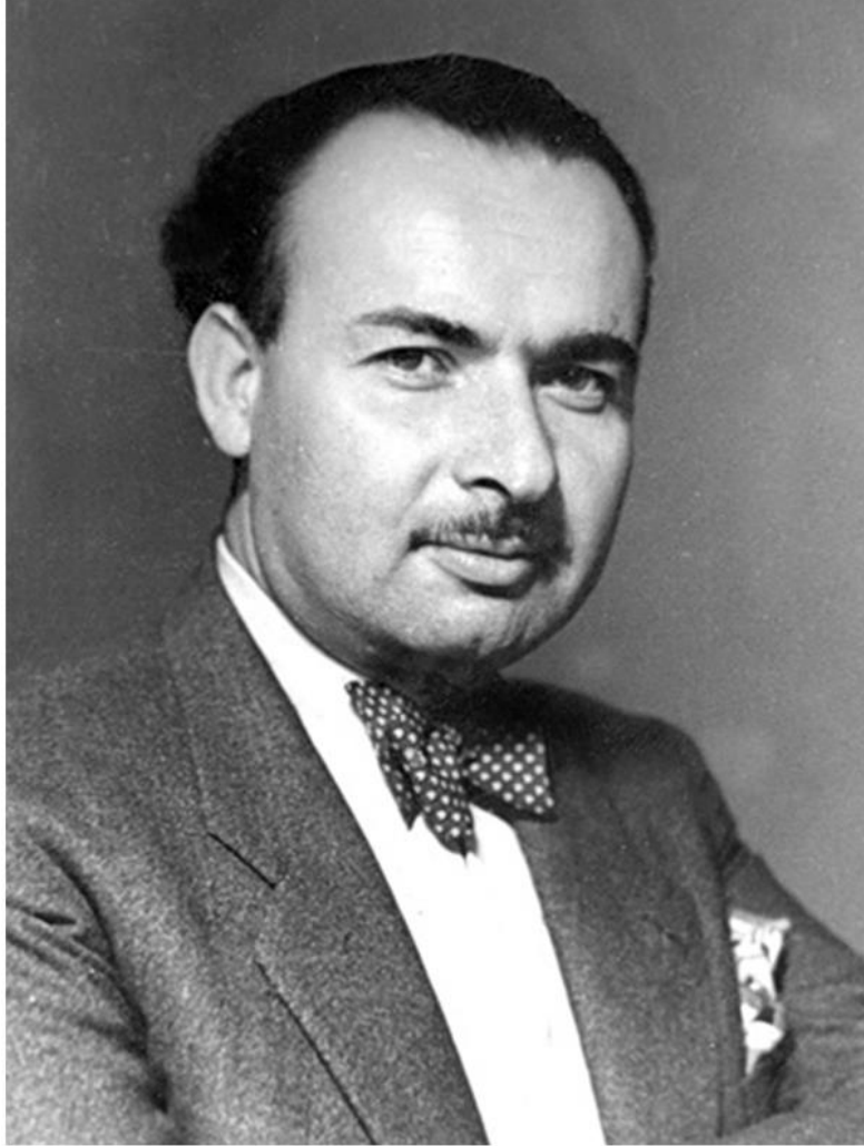
Necil Kazım AKSES (1908-1999)

6 Mayıs 1908, İstanbul – 16 Şubat 1999, Ankara