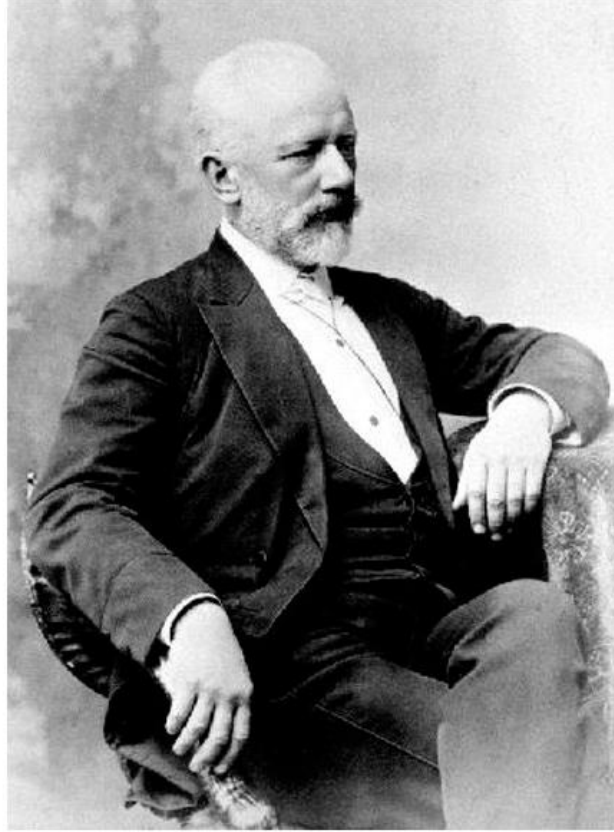
Pyotr Ilyich Tchaikovsky (1840-1893)

*Minyatür Uvertür *Karakteristik Danslar: Marş — Şeker Perisi'nin Dansı — Rus Dansı — Arap Dansı — Çin Dansı — Flütlerin Dansı * Çiçeklerin Valsi