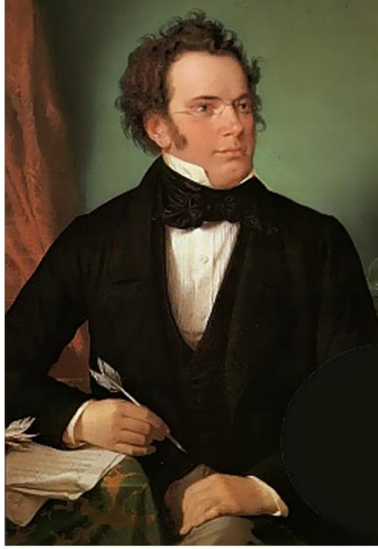
Franz Schubert (1797-1828)

*Allegro *Andante con moto * Scherzo (Allegro molto) *Presto