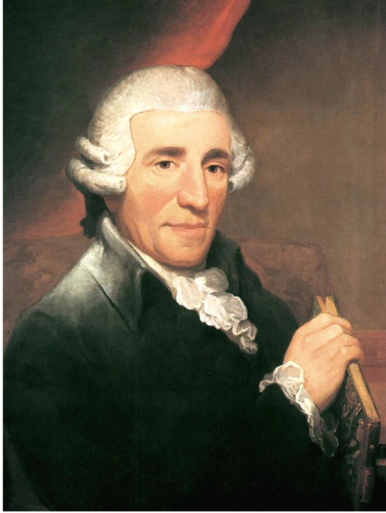
Franz Joseph HAYDN (1732-1809)

Franz Joseph Haydn'in Ressam Thomas Hardy tarafından yapılan bir portesi