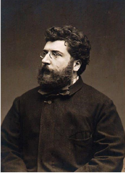
Georges Bizet (1838-1875)

25 Ekim 1838 Paris – 3 Haziran 1875 Bouglival, Yvelines, Fransa