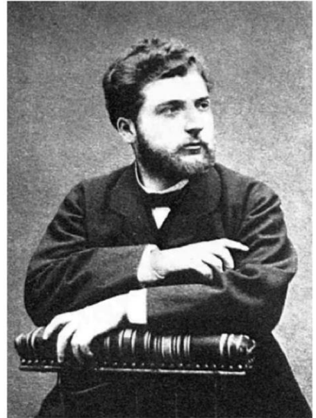
Georges Bizet (1838-1875)

Ancak zamanla depresyona girerek kendi sanatsal değerini sorgulamaya başladı, endişeleri nedeniyle bazı projelerinden vazgeçti, bestelediği bazı operaları yaktı.