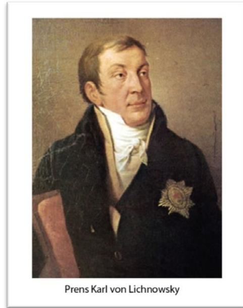
Prens Karl von Lichnowsky

sinirsel enerji dünyasına adım atar. İlk ölçü coda'sının (bitişten sonraki bölüm) doruk noktası, Beethoven'in bütün ürünlerinin en iç parçalayıcı ve coşkulularından biri olarak değerlendirilebilir.