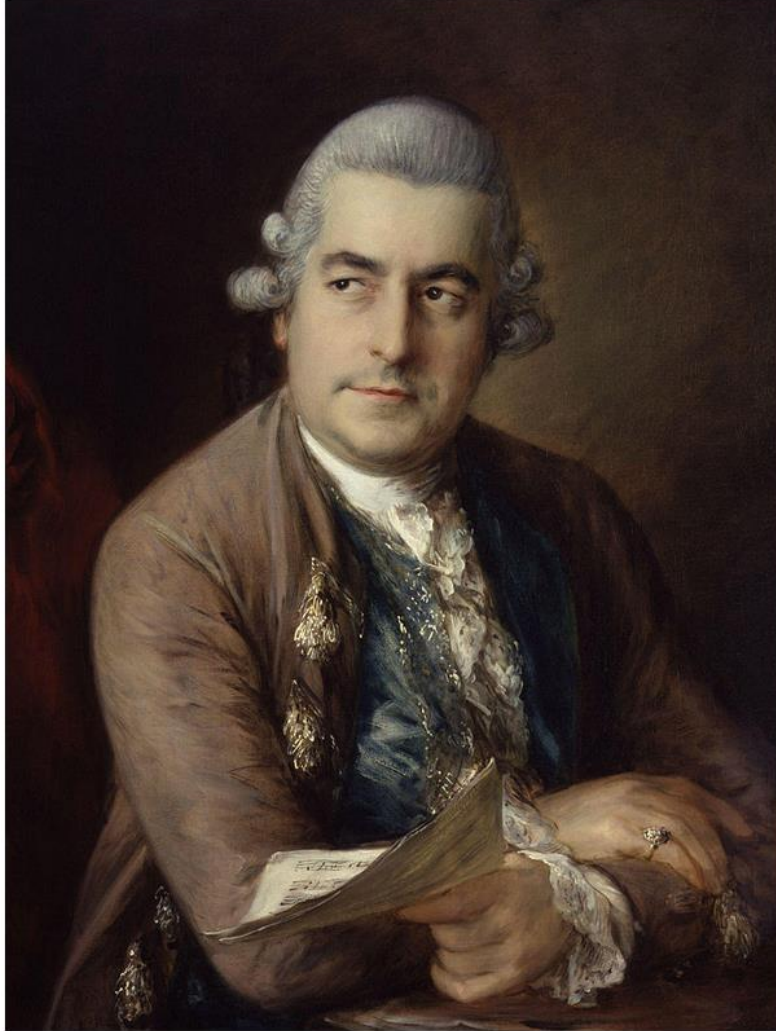
Johann Christian BACH (1735-1782)